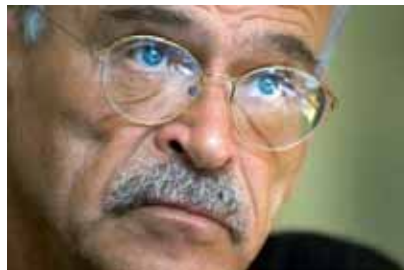
Günter Wallraff macht die skandalösen Arbeitsbedingungen in Call-Centern publik.

die Rechtsprechung eindeutig verbietet, einen beliebigen Bürger zuhause anzurufen und ihm ein Geschäft anzubieten, wird genau das von den Mitarbeitern des Call-Centers verlangt. Was Wallraffs Recherche beweist, ist die Tatsache, dass es neben einigen seriösen Unternehmen in der Branche viele schwarze Schafe gibt. Ein Problem ist