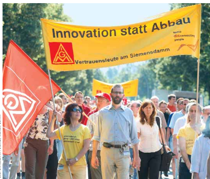
Beim Aktionstag von Nokia Siemens Networks im Juni protestierten tausende Beschäftigte gegen den Stellenabbau.